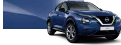
Safir Mavi (M) - RBN