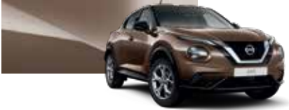
Hipnotik Bronz (M) - CAN