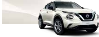
İnci Beyazı (P) - QAB