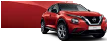
Lav Kırmızı (O) - Z10