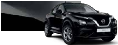
Siyah (M) - Z11