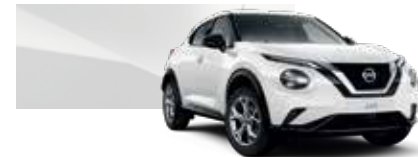
Beyaz (O) - 326