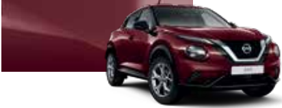
Bordo (M) - NBQ