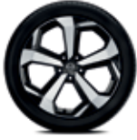
19" Alaşım Jant