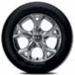
17" Alaşım Jant