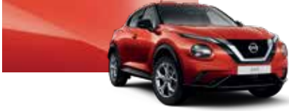
Gün Batımı Kırmızı (P) - NBV