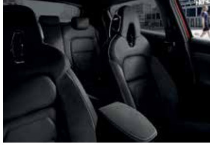
Siyah Deri / Siyah Alcantara*

*Platinum Perso versiyonundan itibaren sunulmaktadır.