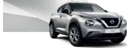
Gümüş (M) - KYO