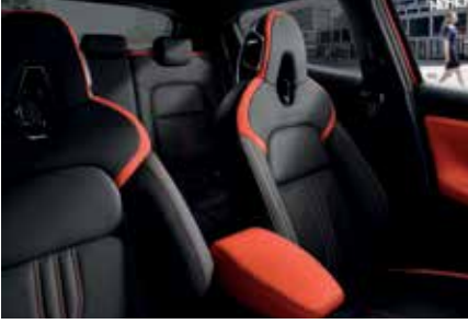
Siyah Deri / Turuncu Kumaş Detaylar*