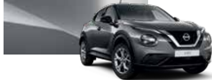
Metalik Gri (M) - KAD